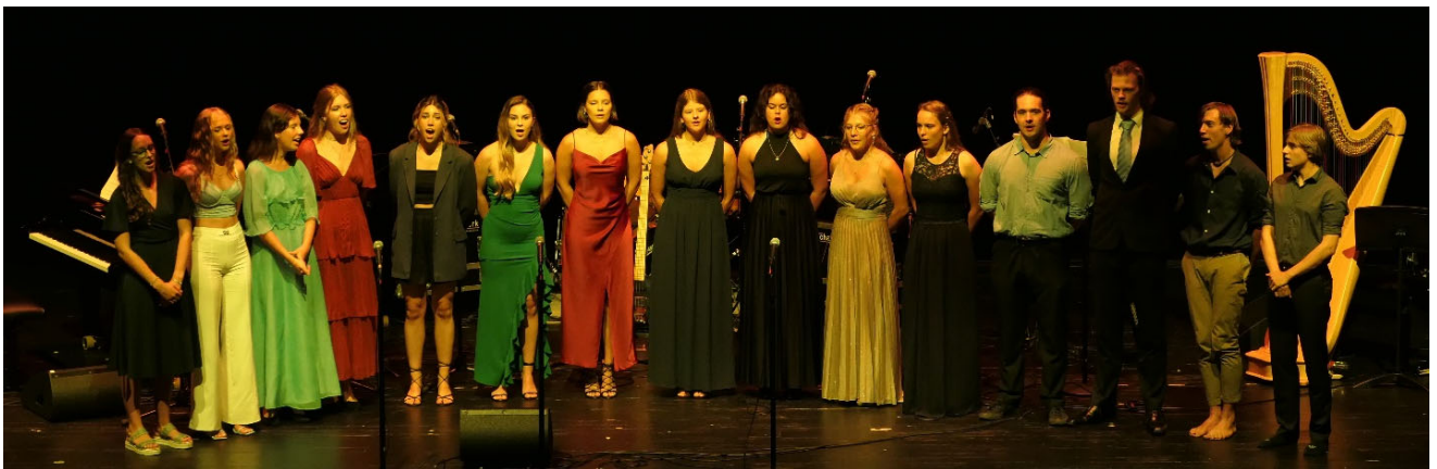
Schwerpunktfach Musik der 4. Klassen, Maturafeier 2022

Als Vorbereitung auf die Vorspiele im Rahmen der mündlichen Matura des Schwerpunktfachs Musik präsentieren die Maturandinnen und Maturanden ihr Können auf dem persönlichen Instrument oder mit der Stimme. Mit dem Konzert wird die minutiöse Vorbereitung im Instrumental- und Gesangsunterricht sowie zu Hause honoriert.