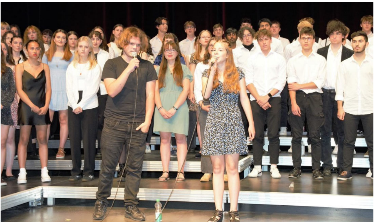
Chorkonzert der 2. Klassen 2022

Schwelgen Sie ganz in den grossen Schweizer Hits bekannter Mundart-Interpreten und küren Sie mit uns ihren Lieblingssong.