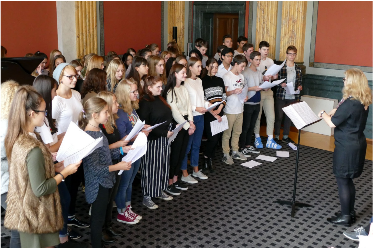
Mittagskonzert am Tag der offenen Schule 2017