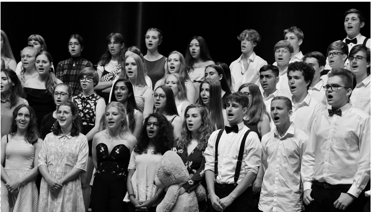
Chorkonzert der 2. Klassen 2019

Die Schülerinnen und Schüler der 2. Klassen mit dem Schwerpunktfach Musik präsentieren ein abwechslungsreiches Konzert mit einer grossen Vielfalt an Instrumenten, Stilrichtungen und Kompositionen.