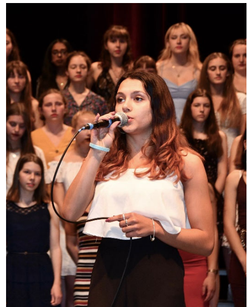
Chorkonzert der 2. Klassen 2019

Pop/Rock-, Jazz- und Klassikensembles geben dem Publikum Einblick in die Arbeit des vergangenen Semesters und zeigen dabei die musikalische Stilfülle auf, die an der Kantonsschule Musegg Luzern gepflegt wird.