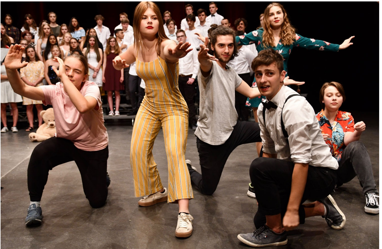
Chorkonzert der 2. Klassen 2019

Ueli Reinhard, Prorektor und PR-Beauftragter